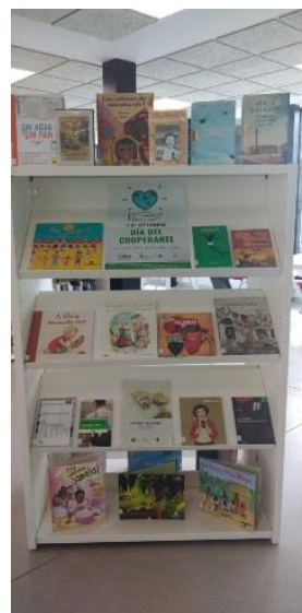
Biblioteca Municipal de Cueto (Santander).