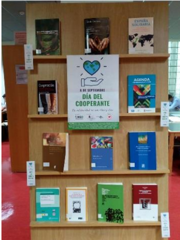
Biblioteca Universitaria. División Derecho, Ciencias Económicas y Empresariales (UC).