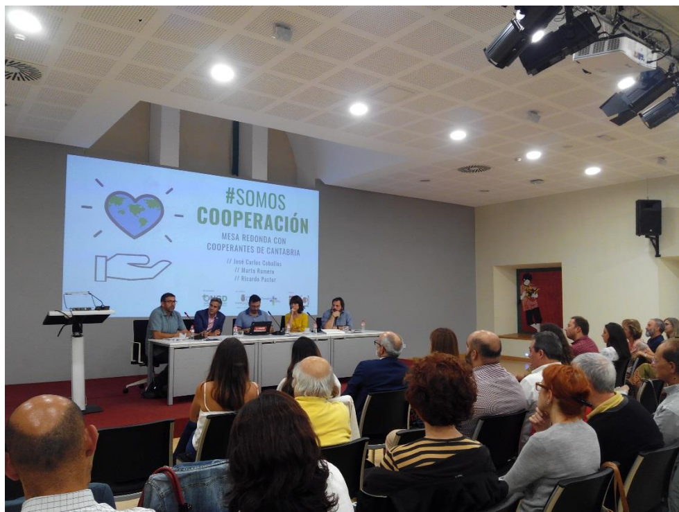
Mesa redonda. Biblioteca Central de Cantabria.