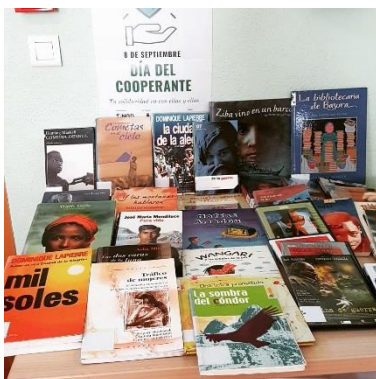
Biblioteca Municipal de El Astillero.