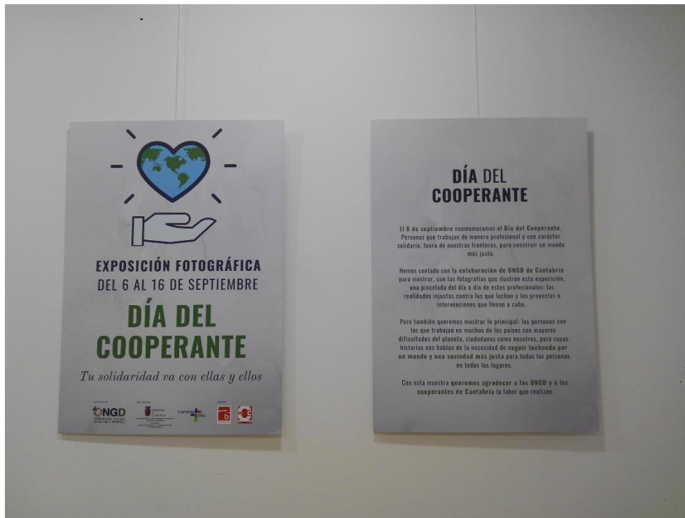
Exposición fotográfica. Biblioteca Central de Cantabria.