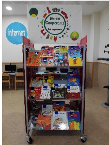
Biblioteca Central de Cantabria. Centro de interés infantil.