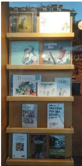
Librería Gil (Santander).