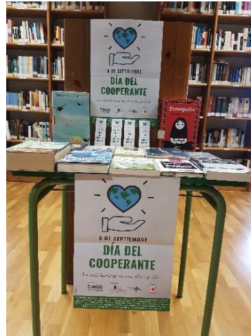
Biblioteca Municipal de Comillas.