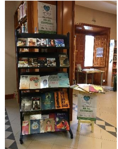
Biblioteca Municipal de Reinosa.