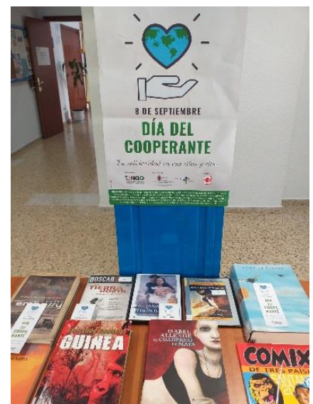
Biblioteca Municipal Ateca (Santander).